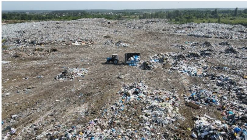
Фото. Полігон ТПВ м.Житомир

затверджено Національний план управління відходами до 2030 року і з метою недопущення забруднення навколишнього природного середовища кожна з областей України має розробити власний регіональний план управління відходами, який врахує структуру економіки, обсяги утворення різних типів відходів, наявні та необхідні потужності для екологічно безпечного оброблення відходів. Дана система управління відходами має враховувати думки на місцях, тому саме регіональні плани є запорукою як розвитку області так і громад, та необхідною умовою для залучення інвестицій у галузь управління відходами. Загальні показники управління з відходами за звітний період