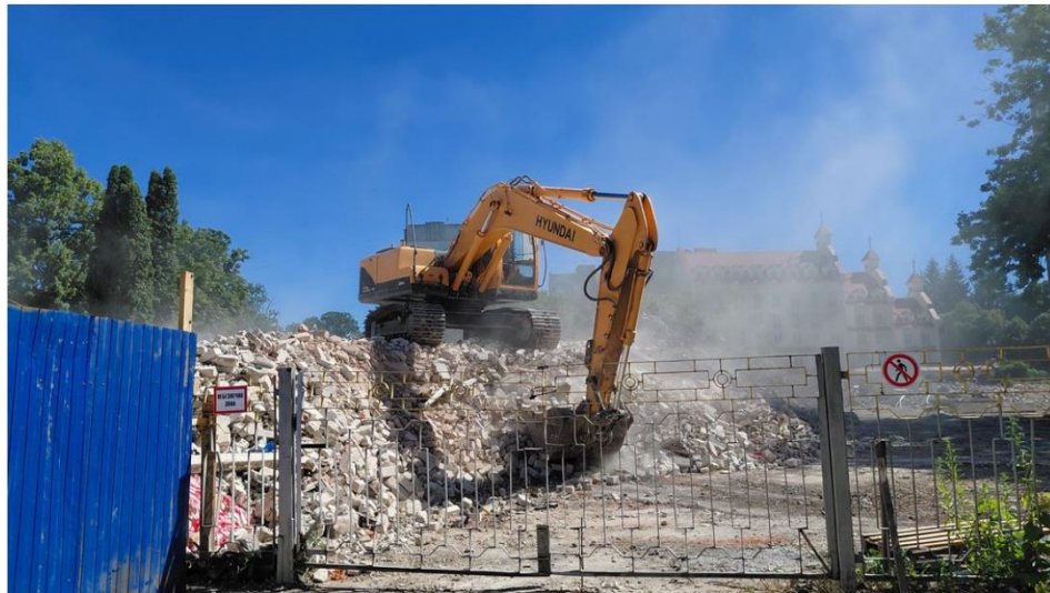
Рис. 3.2.3.1 Процес знесення будівлі ліцею № 25

у поєднанні з традиційними методами знесення дозволяє громадам підтримувати місцеву економіку, пов'язану з виробництвом і обробленням; виключення необхідності захоронення відходів.