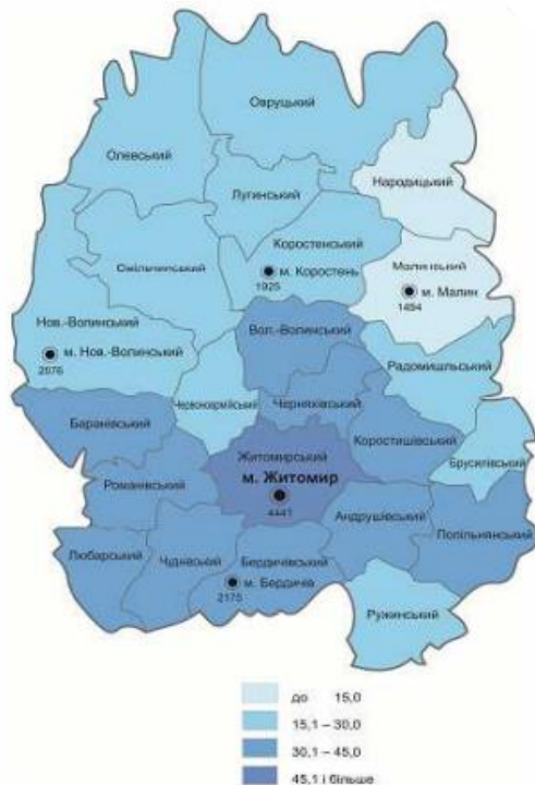
Рис. 3.2.1. Щільність населення Житомирської області, осіб на 1 кв. км

адміністративно-територіальний устрій області та межі територіальних громад.