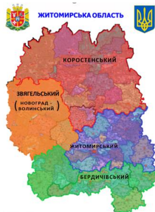
Рис. 3.2.1.2. Картохема поділу Житомирської області на зони охоплення (кластери) на основі нового адміністративно-територіального поділу області (сценарій № 2)

Джерело: Департамент екології та природних ресурсів Житомирської ОДА