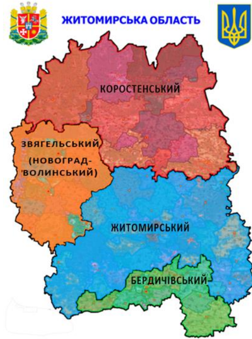
Рис.3.2.1.1. Картохема поділу Житомирської області на зони охоплення (кластери) на основі нового адміністративно-територіального поділу області (сценарій № 1)